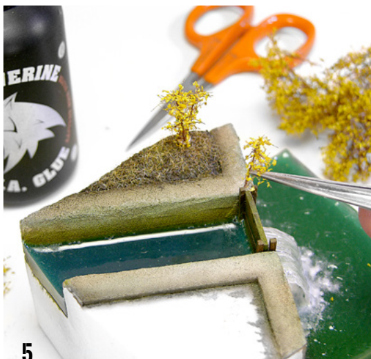
5 The rigidity of its trunk allows them to be fixed with some white glue directly on the ground without the need to make any holes. La rigidez de su tronco permite fijarlas con algo de cola blanca directamente sobre el terreno sin necesidad de practicar orificio alguno.