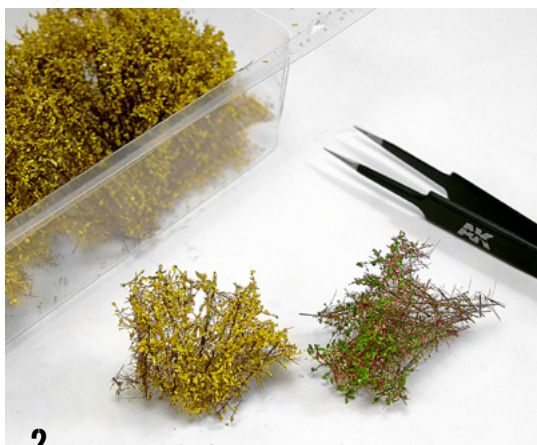
2 We can use a single type of vegetation or combine different colors to achieve greater dynamism and color variety. Podemos usar un único tipo de vegetación o combinar diferentes colores para lograr mayor dinamismo y variedad cromática.