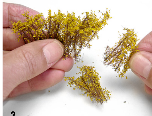
3 The bushes are easily detached from the set and thanks to its semi-rigid trunk it allows us to easily select its size and shape. Los arbustos se desprenden con facilidad del conjunto y gracias a su tronco semi-rígido nos permite seleccionar fácilmente su tamaño y forma.