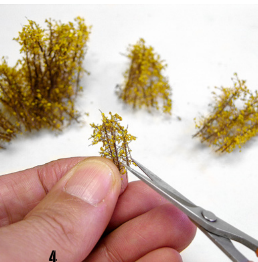
4 We will set the necessary height by cutting with small scissors. Fijaremos la altura necesaria cortando con unas tijeras pequeñas.