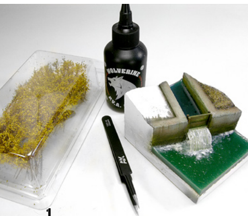
1 To start working we will only need tweezers, small scissors and white glue. Para comenzar a trabajar tan solo necesitaremos unas pinzas, unas tijeras pequeñas y cola blanca.